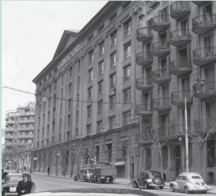
Façana de l'edifici David al carrer Aribau, els anys cinquanta.

Actualment, el carrer Aribau és una de les principals vies de trànsit de Galvany, en sentit mar-muntanya (la veïna Muntaner ho és de muntanya-mar). Atrau comerç i hi ha diversos establiments hotelers, però manté el caràcter residencial. ■