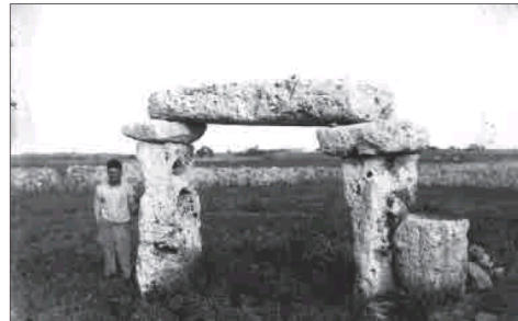
Restes arqueològiques a Son Saura Nou, Ciutadella.