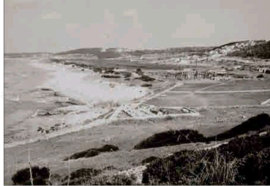
Arenal de Son Bou I, a la dreta, els dos hotels quan es començaven a construir.