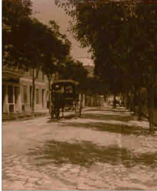
Ses Moreres, Maó.