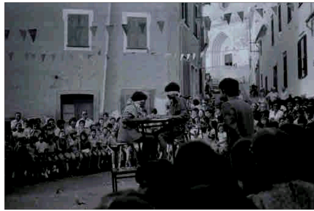
Jocs populars al pla d'en Borràs, la plaça que hi ha a l'inici de la Costa de l'Església, a Alalor.