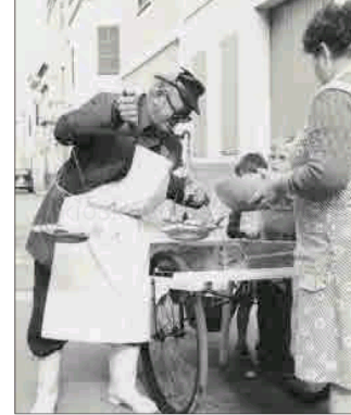
Venedor de pelx a Ciutadella.